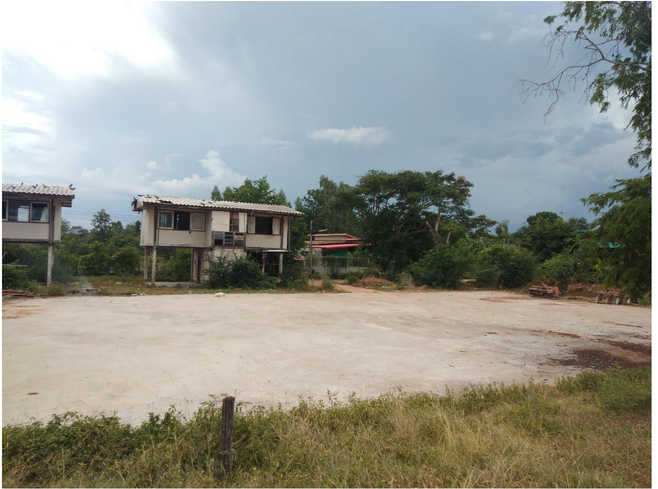
สนามกีฬา หมู่ที่ ๓