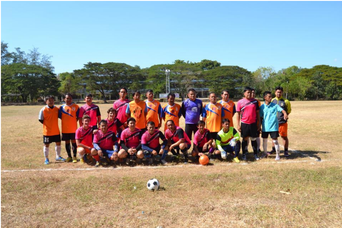
สนามกีฬา หมู่ที่ ๑