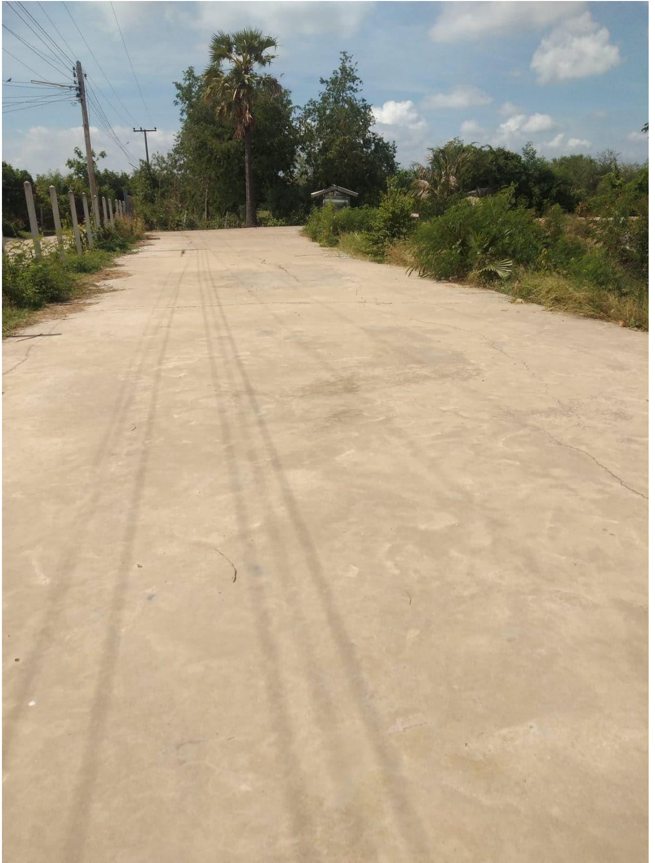
สนามกีฬา หมู่ที่ ๑๑