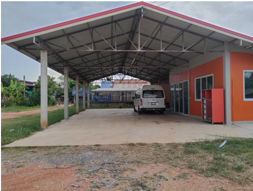
สนามกีฬา หมู่ที่ ๙