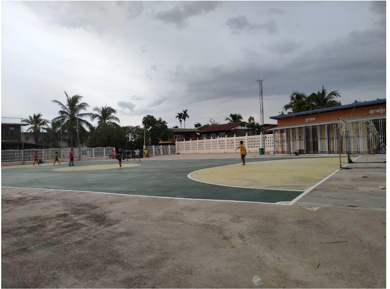
สนามกีฬา หมู่ที่ ๔ และ ๑๒