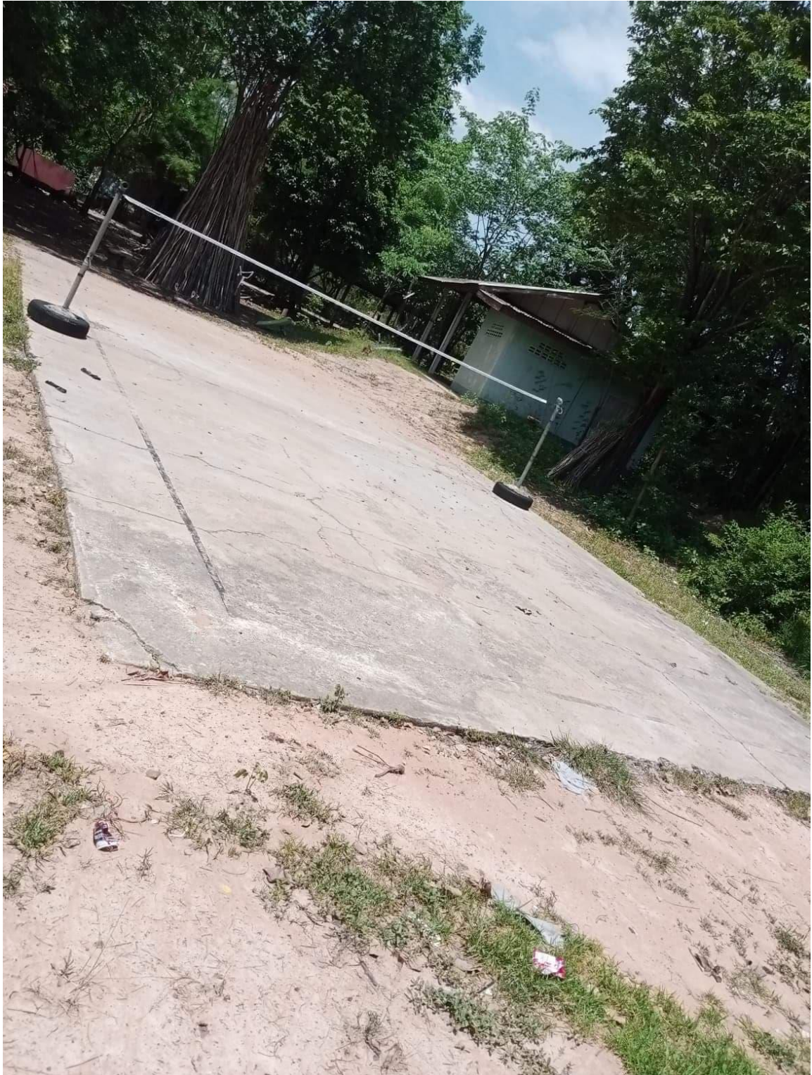
สนามโรงเรียนหนองบัวบานวิทยา หมู่ที่ ๒