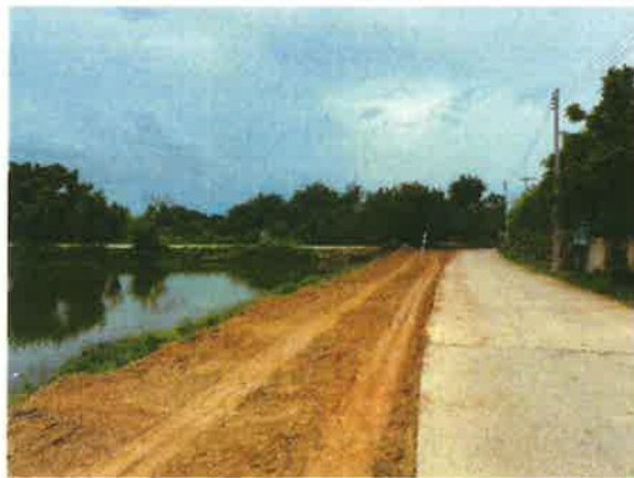
ภาพถ่ายก่อนดำเนินการ