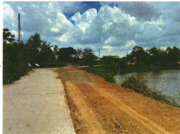
ภาพถ่ายขณะดำเนินการลงทรายหยาบรองพื้นทาง